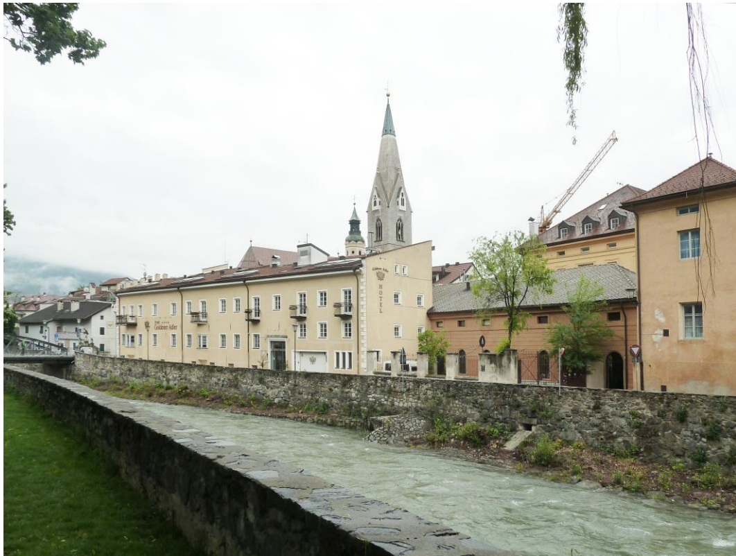
Foto 1_ prospetto est affaccio sul fiume