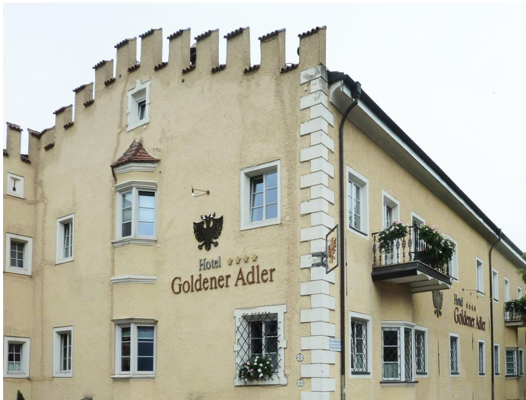
Foto 2_ Zufahrt Adlerbrücke / Ingresso da Via Ponte Aquila alto