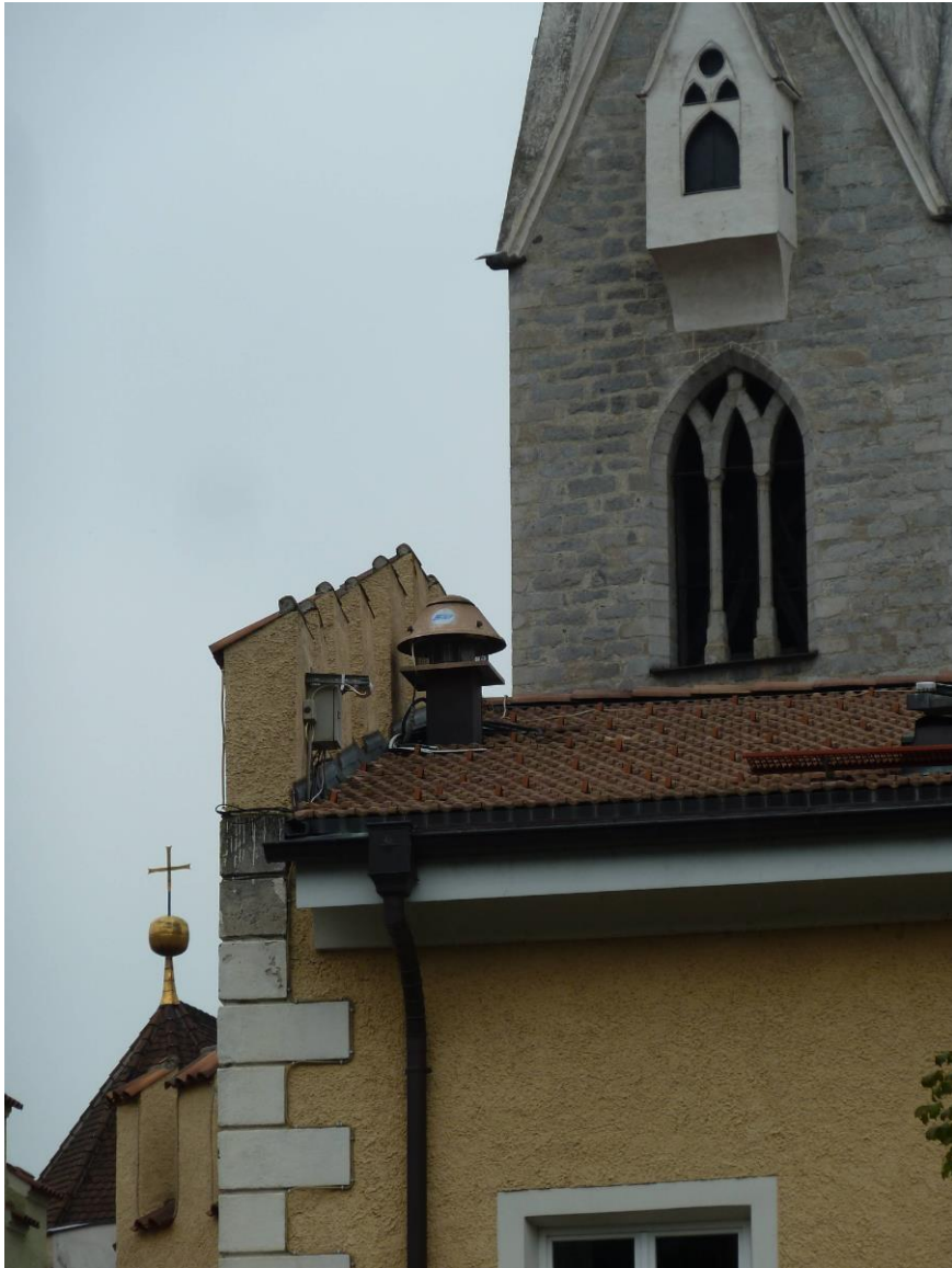
Foto 4_ dettaglio merlature in copertura