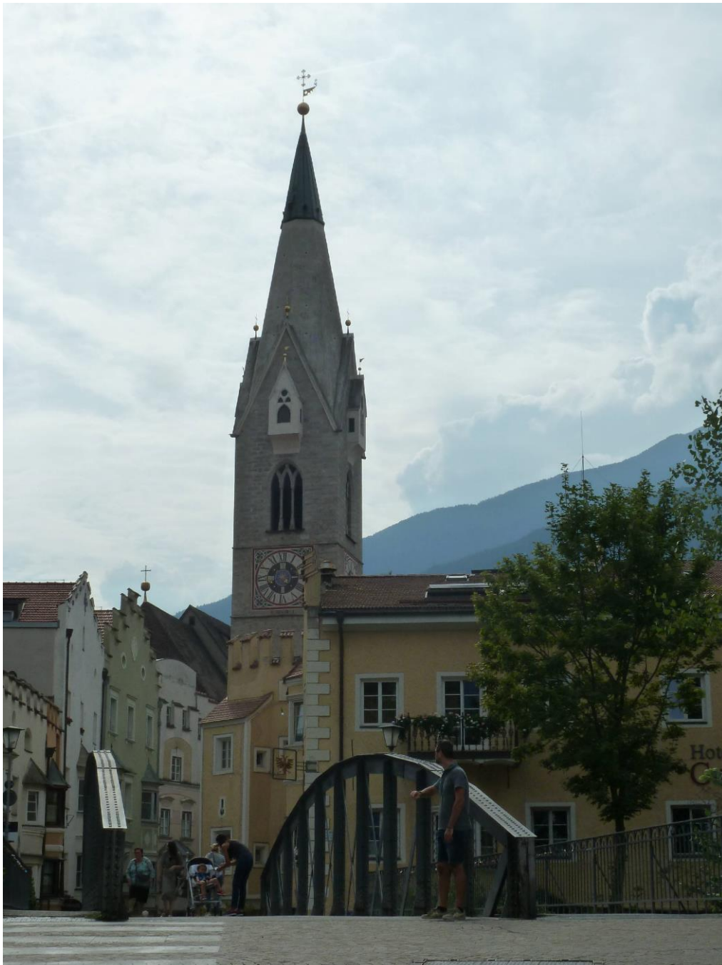
Foto 3_ vista dal ponte aquila