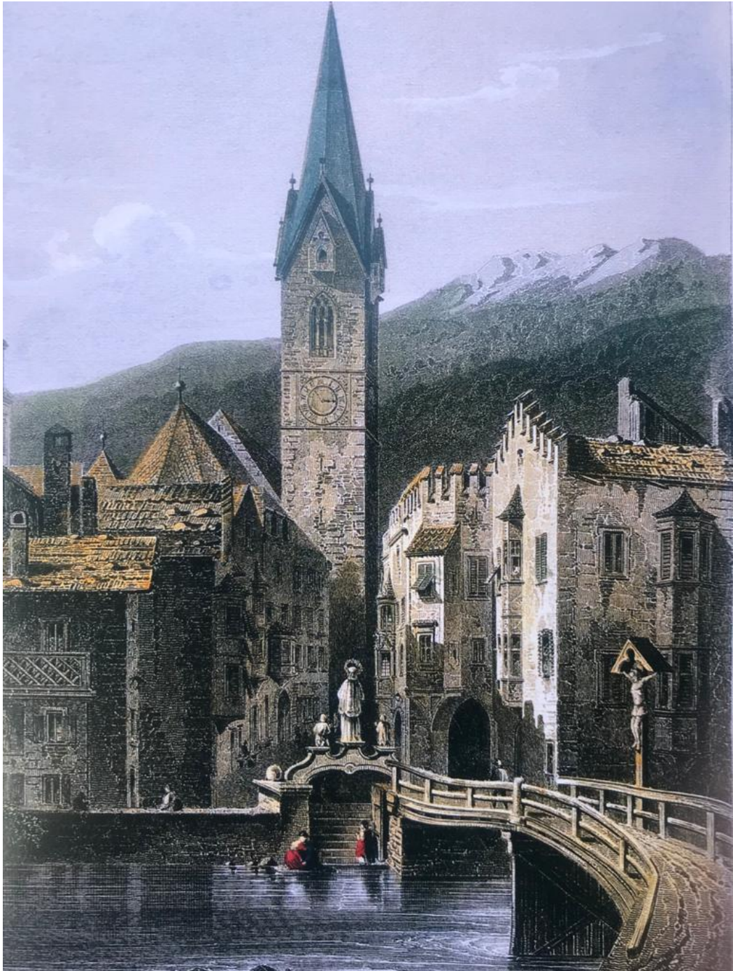
Foto 5_ immagine storica